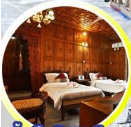
บ้านเรือ..วิมานบนดิน