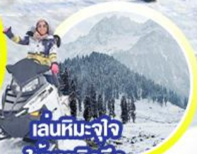
เล่นหิมะ-ใจ ให้หายคิดถึง